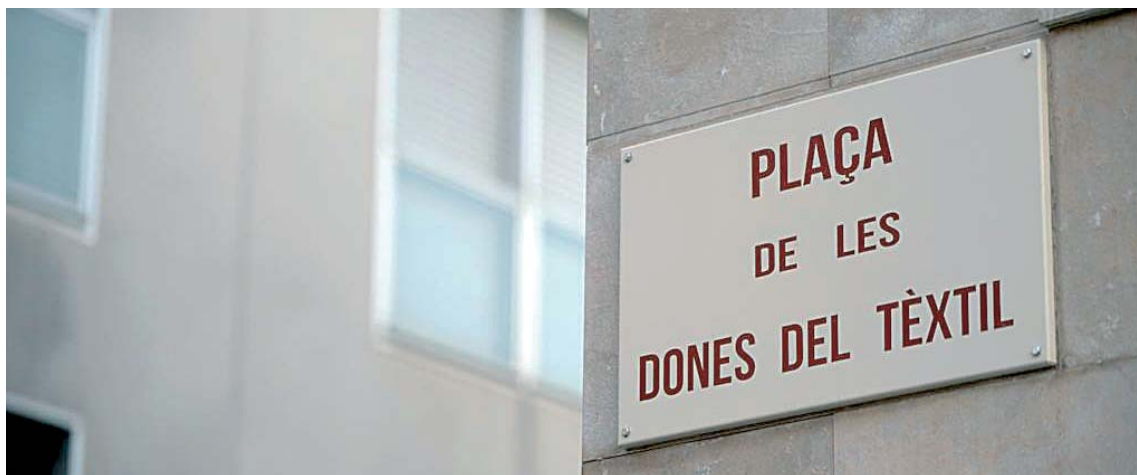
La nova plaça de les Dones del Tèxtil