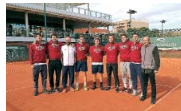
El Cercle va salvar la categoria a la promoció de permanència