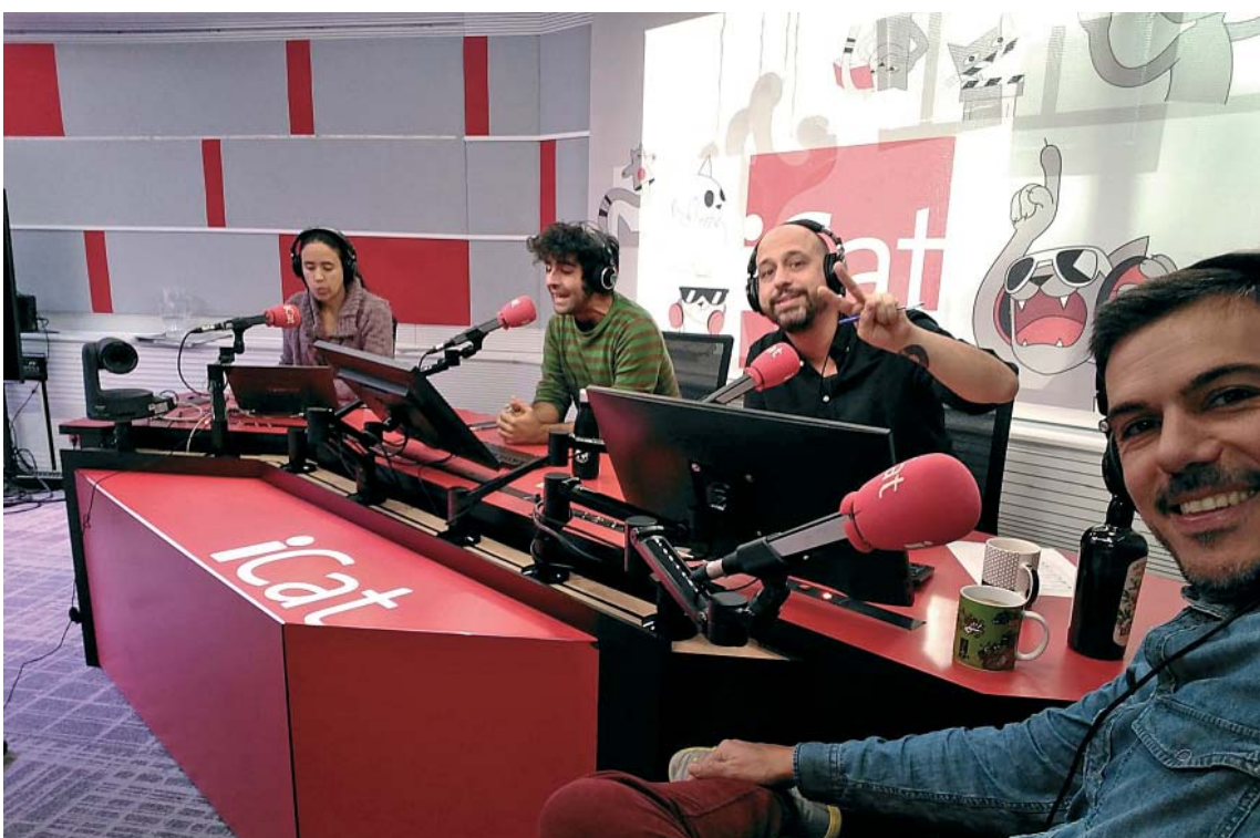
A l'ex de Ràdio Sabadell se'l pot seguir ara a iCat.fm | Cedida

Enfilats va rebre una menció de qualitat de Ràdio Associació de Catalunya