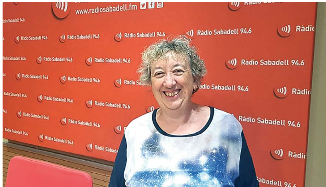
Estapé als estudis de Ràdio Sabadell | RS

L'altra notícia és que l'inici del curs s'ha avançat respecte a altres edicions i arrencarà el 27 de novembre. "Els estudiants ens deien