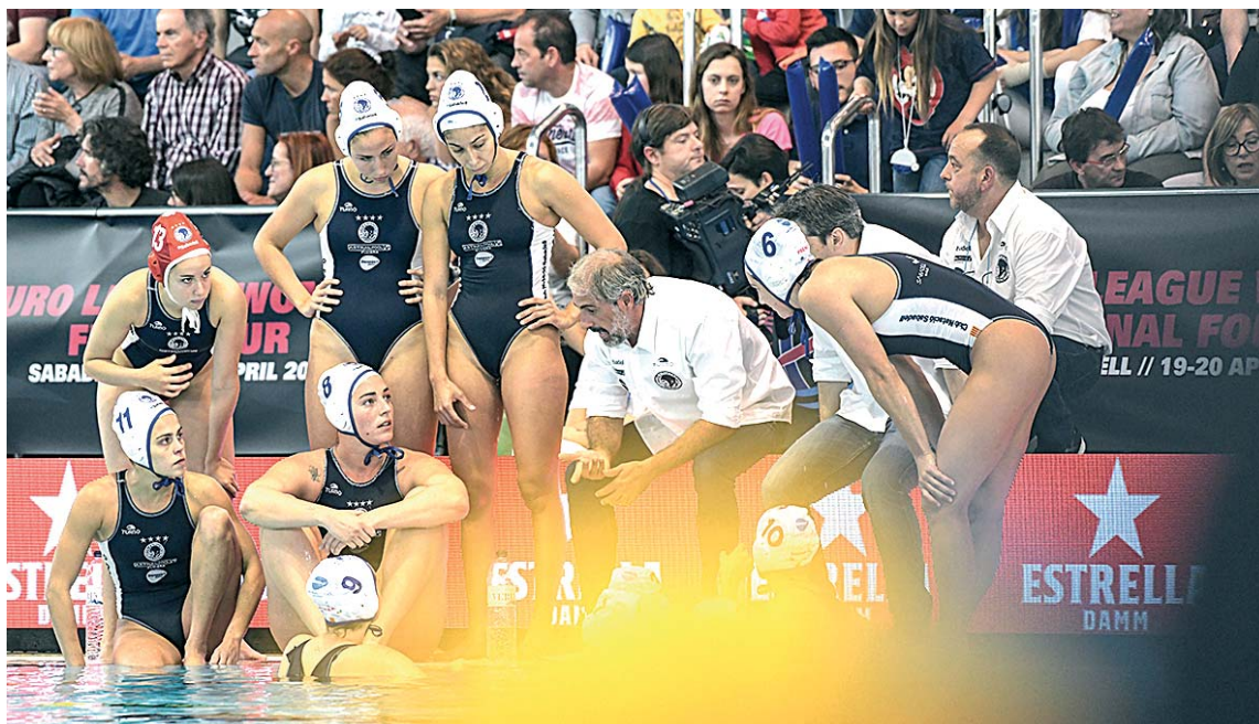
Les noies del Club tenen una nova cita europea a Can Llong