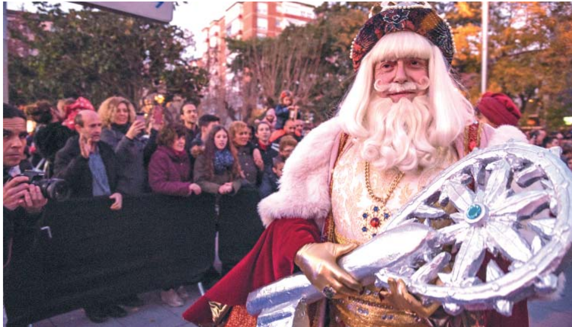
L'entrega de la clau de la ciutat als Reis és un dels moments més esperats

El tret de sortida de l'època nadalenca se celebrarà el 29 de novembre amb l'encesa de llums. Enguany, aquest acte es repetirà en tres espais diferents de la ciutat: al Mercat Central, a la plaça del Pi i a la Creu de Barberà. Una novetat