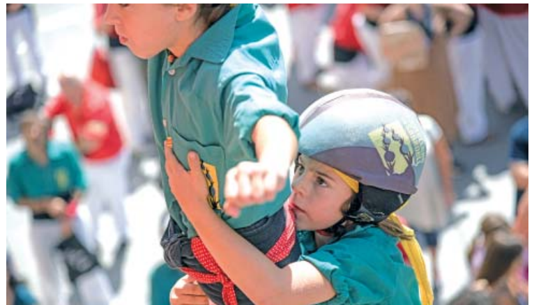
Els Saballuts han perdut aquest any la seva condició de Colla de 9

"picar pedra" i preparar els relleus que l'any ve han de tornar la força i la llum als Castellers de Sabadell.