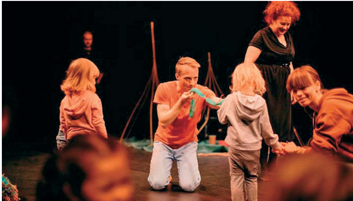
Un dels espectacles de El Més Petit de Tots d'aquest any | Oficial

L'espectacle Tumble in the jungle es podrà veure al Mercat de les Flors de Barcelona demà (11 i 16.30h) i diumenge (11h). Al mateix espai es podrà gaudir d' Et