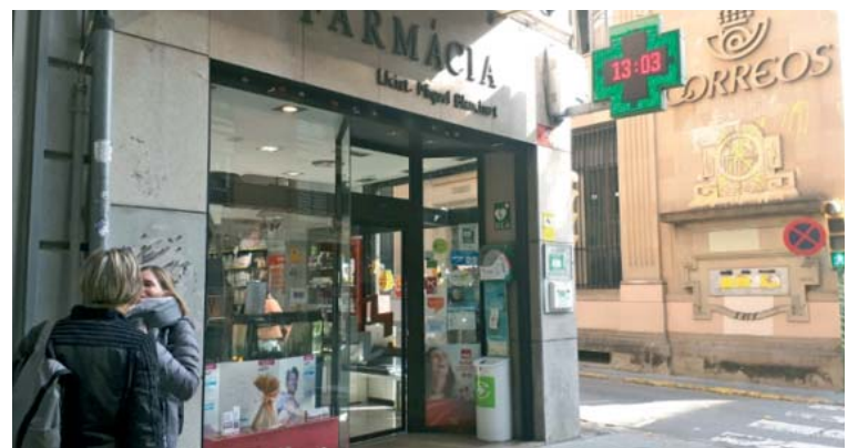
Reconeixement per a la Farmàcia Blanchart