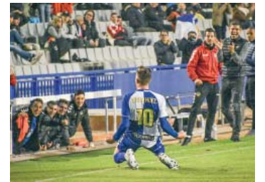
Celebració del gol de falta directa diumenge passat a la Nova Creu Alta contra el Nàstic