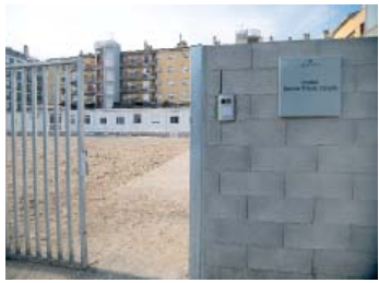
Es mantenen els problemes logístics al centre | Roger Benet

Dos mesos de provisionalitat a l'Institut Narcisa Freixas