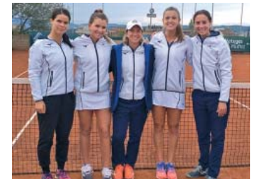
Les noies del CTS es mantenen entre els vuit millors equips del tennis espanyol | Oficial